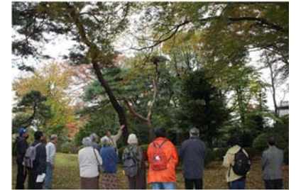
2011年のみどりのまち歩き

深沢八丁目無原罪特別保護区をご存じでしょうか？ 11月26日（土）特別公開日の午後、深沢の杜緑地と合わせて、一緒に散策しませんか？