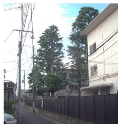
10mを超えるヒマラヤ杉